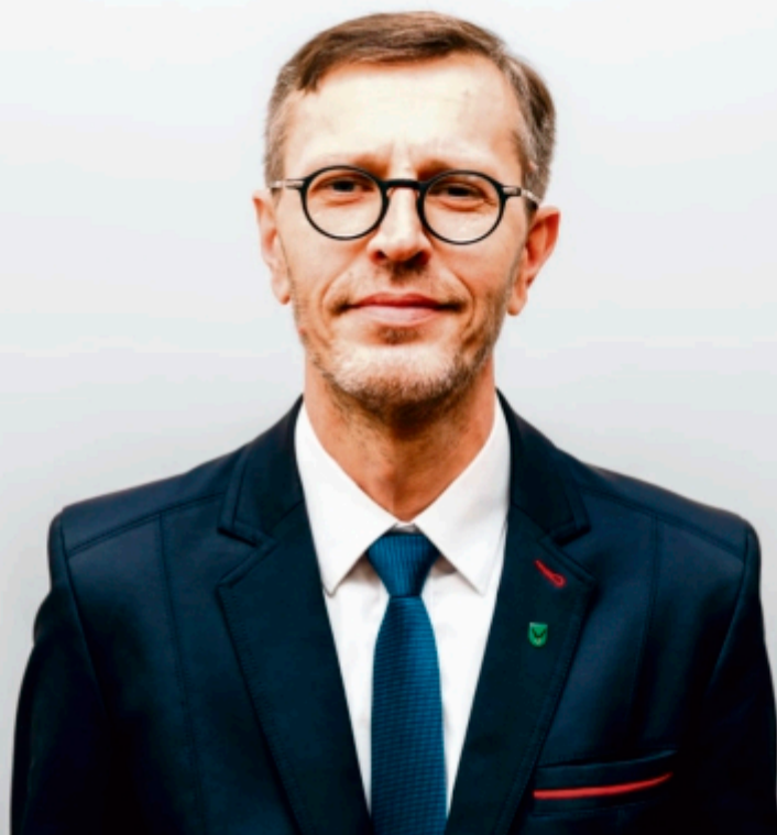
Materiał wyborczy pochodzi i jest sfinansowany przez KWW Jastrzębie 2.0

Kandyduję do Rady Miasta z list KWW Jastrzębie 2.0 z miejsca nr 1 w okręgu nr 3. Proszę o Wasz głos w Wyborach Samorządowych i deklaruję, że połowę diety przeznaczę na cele charytatywne